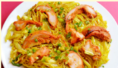
17. チキンチャオミン