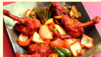
23. チキンロリポップ